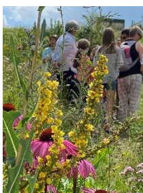
Bienentrachtgarten am Naturpark-Infozentrum Hermeskeil,

Infos zum Naturpark bei der Naturpark-Geschäftsstelle in Hermeskeil, Tel. 06503/9214-0, www.naturpark.org .