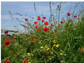
Blüten am Feldrain und in der Wiese

Am Freitag, 21. Juni 17:30 bis 20:00 Uhr , führt der Naturpark Saar-Hunsrück in Kooperation mit der Naturpark-Verbandsgemeinde Hermeskeil einen kulinarischen Wildkräuterspaziergang um Hermeskeil durch. Zusammen mit der Naturpark-Referentin Gabi Reinartz, können Sie die wilden Vorfahren, die Urform der Kulturpflanzen, die Wildkräuter entdecken, bestimmen und auch schmecken. Wildkräuter mit ihren wertvollen Inhaltstoffen wachsen vor der Haustür und können einen gesunden und kostenfreien Teil unserer Nahrungsgrundlage bieten. Welche Pflanzen sich gut für die Alltagsküche verwenden lassen und welche Sammelpraxis sich bewährt, können Sie erfahren. Die Teilnahmegebühr beträgt 15 Euro pro Person inkl. Kräutersnack. Der Treffpunkt wird bei Anmeldung bekannt gegeben. Eine verbindliche Anmeldung ist bei der Naturpark-Geschäftsstelle in Hermeskeil, Telefon 06503/9214-0, erforderlich (Teilnahmebegrenzung).